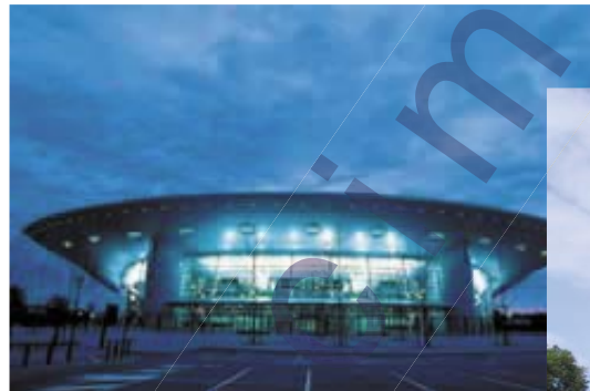
Le Zénith de Toulouse